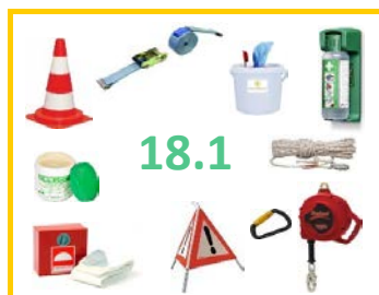
18.1 Arbeitssicherheits- u. Pflegeprodukte

Unser Sortiment wird laufend erweitert. Fragen Sie uns auch an, wenn Sie den gewünschten Artikel nicht finden.