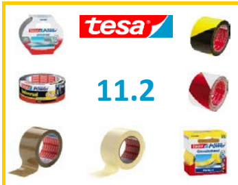
11.2 TESA Klebebänder