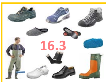
16.3 Stiefel- Arbeitsschuhe