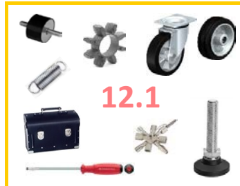
12.1 Eisenwaren, Werkzeuge, Räder/Rollen,