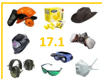
17.1 Atemschutz, Kopf- Augen-Gehörschutz