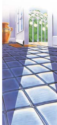
für unebene Böden 11.226.