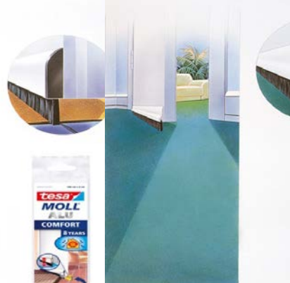
für Textilböden 11.225.